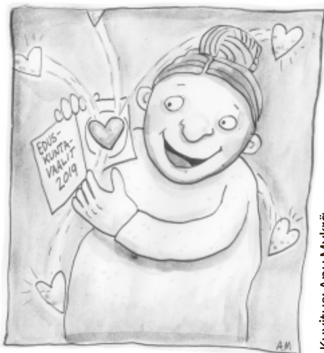
Kuvitus: Anu Mykrä