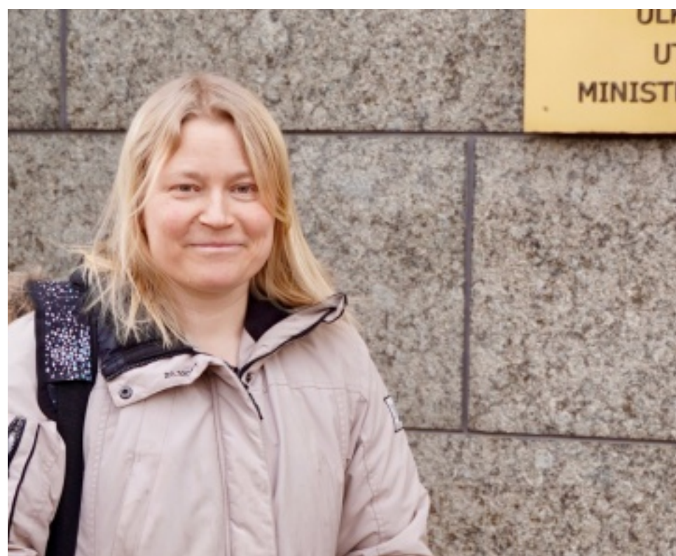
Lotta ja adressit ministeriön ovella.