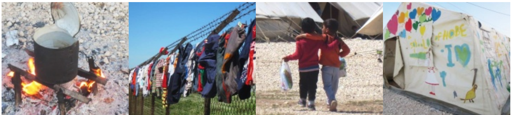
Nämä kuvat on otettu Kreikassa, Katsikan pakolaisleirillä v. 2016.

Yhteiskunnan pohja tulee ensin saada kuntoon. Vasta vakaalle perustalle voi rakentaa kunnollisen talon. Myös yritysmaailman ajattelussa pitäisi ymmärtää tämä. Investointeja pitää tehdä kunnan pohjan luomiseen. Muuten hyvinvointiyhteiskunnastamme kehittyvä kärjellään seisova pyramidi.